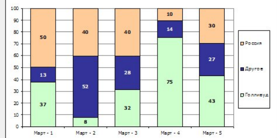
Распределение сборов weekend-a по территории производства